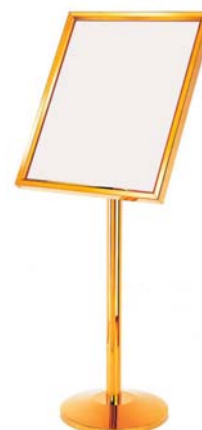
Примерный вариант: Стенд экспозиционный