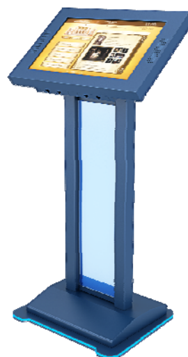
Примерный вариант: Интерактивный сенсорный стол/киоск