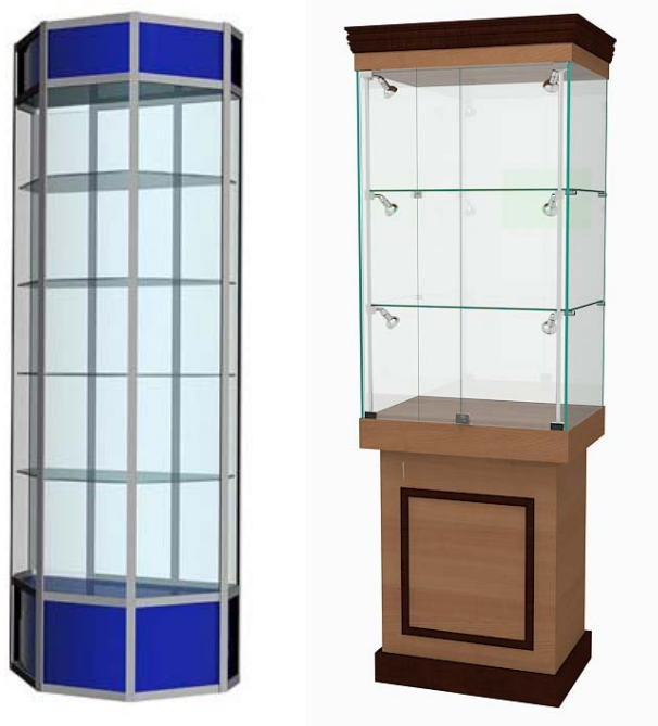
Примерный вариант: Витрина экспозиционная

Рис. 1. Модуль С «Разработка экскурсионных программ обслуживания / экскурсий», Модуль D «Проведение экскурсий»